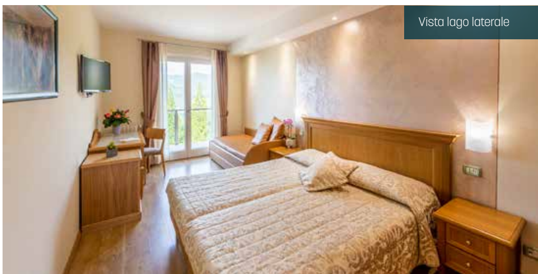
Vista lago laterale