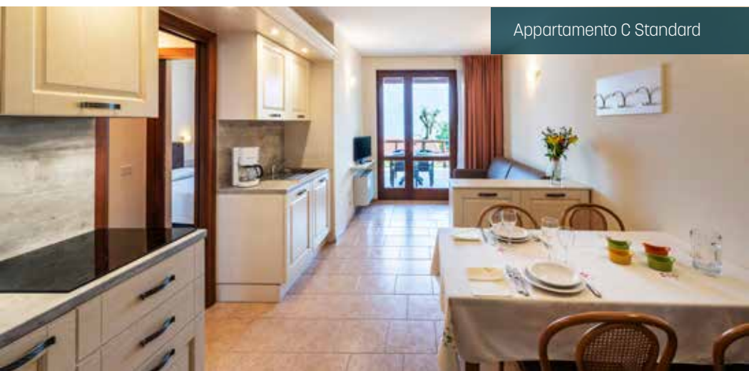
Appartamento C Standard