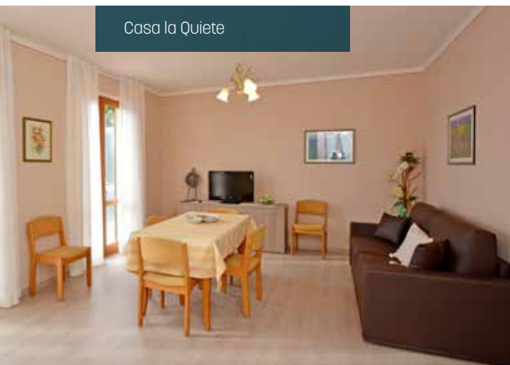
Casa la Quiete

The home is located approx. 100 m from the hotel, above the outdoor swimming pool. It has 2 bedrooms (double bed), living room, kitchen, 1 sofa bed for 2 persons, bathroom, TV-Sat, terrace with lake view, private garden and parking.