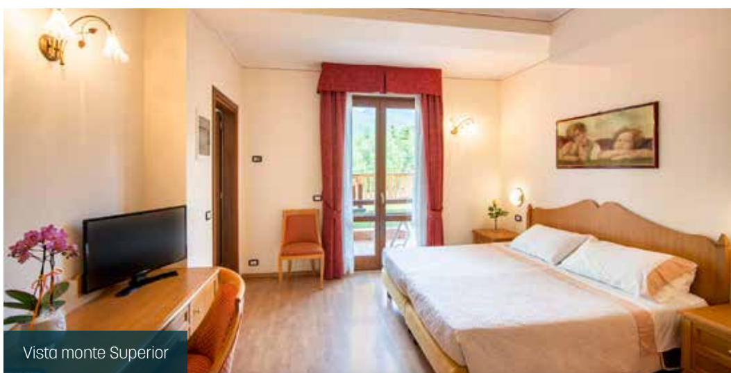
Vista monte Superior