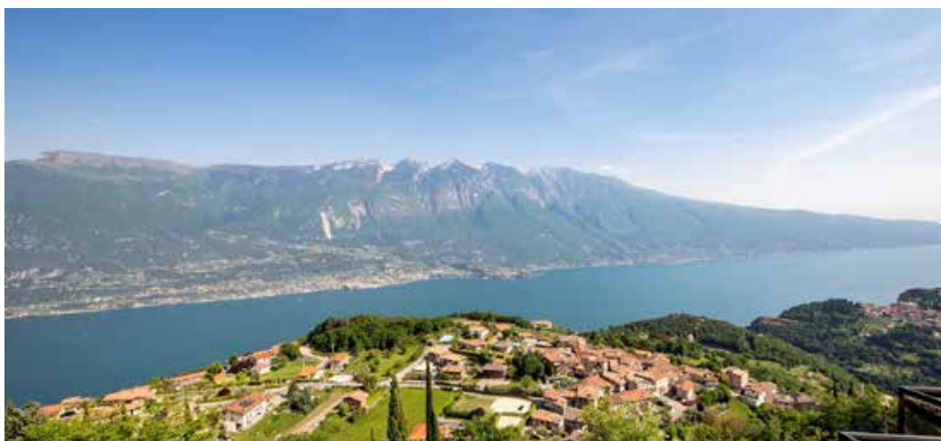
Vista lago Deluxe

If you are looking for a place where to stay in Lake Garda, in Tremosine, Hotel Pineta Campi is the place for you! The hotel has 76 rooms divided between those with a lake view and those with a mountain view, Standard, Superior and Deluxe categories, with balcony or terrace. Recently all rooms have been renovated; each of them is equipped with a bathroom with shower, WC, direct dial telephone, TV-Sat, air-conditioning.