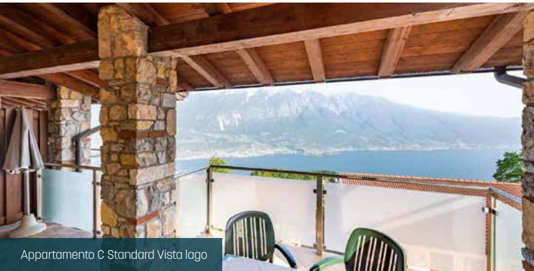
Appartamento C Standard Vista lago