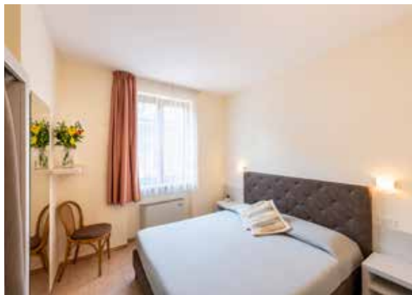
Appartamento B Superior