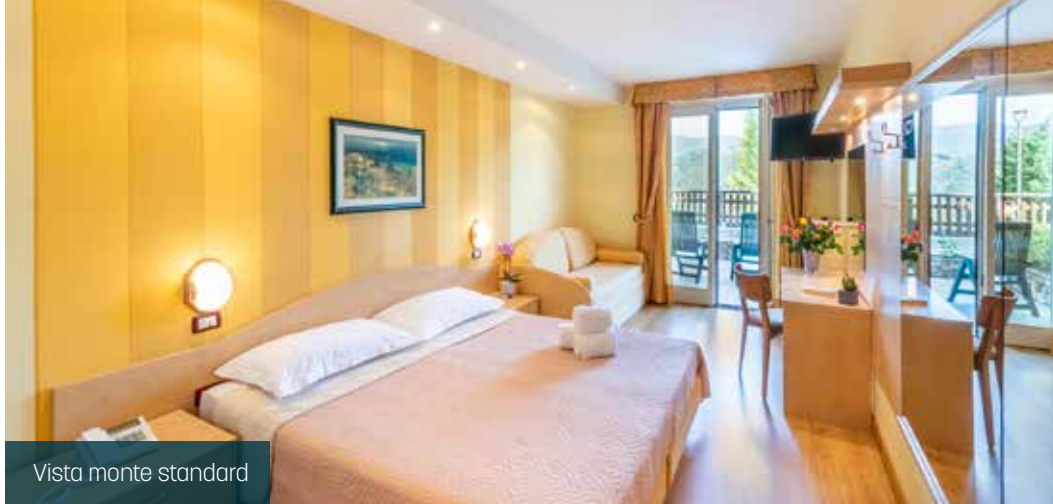
Vista monte standard