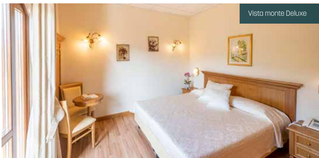
Vista monte Deluxe