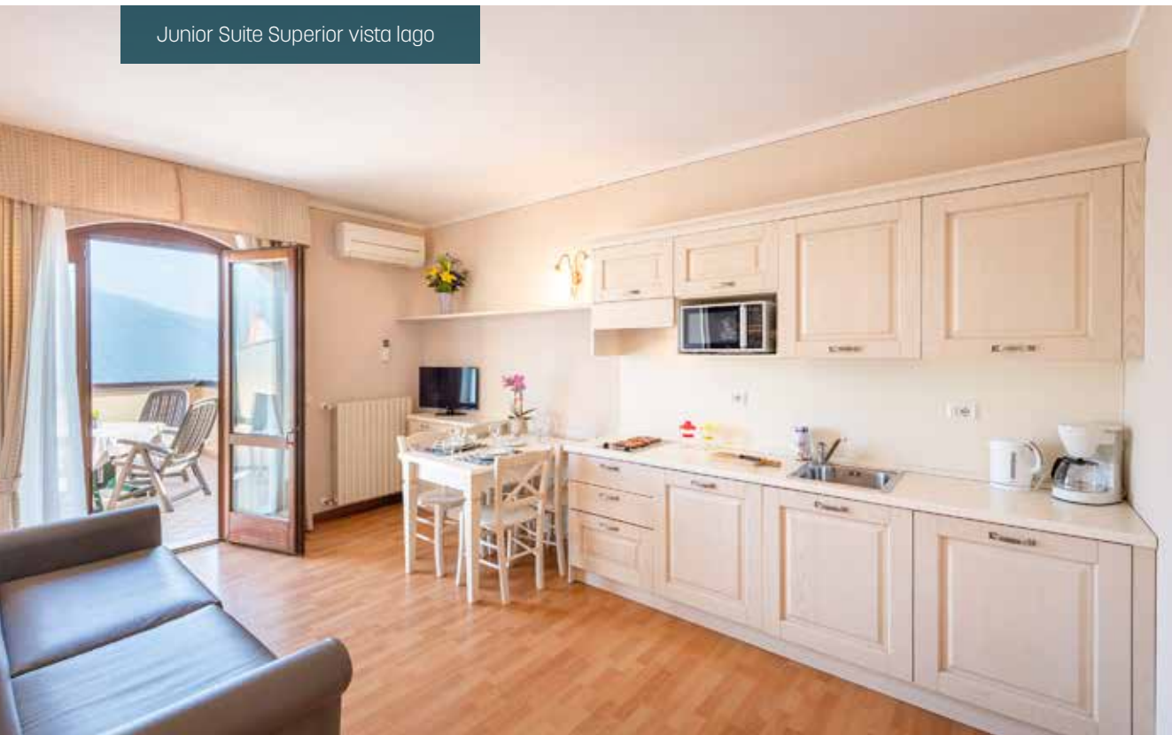
Junior Suite Superior vista lago

Our suites, located inside the structure, are stylishly furnished, comfortable and fully equipped (telephone, TV-Sat, Wi-Fi). During your stay at our hotel, you can enjoy wonderful, breathtaking views overlooking the large terrace or balcony, where you can have breakfast and lunch outdoors surrounded by the magnificent lake view. Guests can enjoy all the many services offered by the Hotel Pineta Campi.