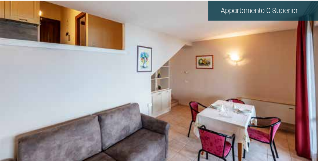
Appartamento C Superior